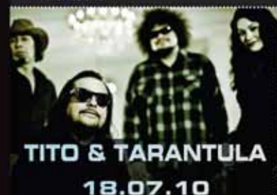
TITO & TARANTULA