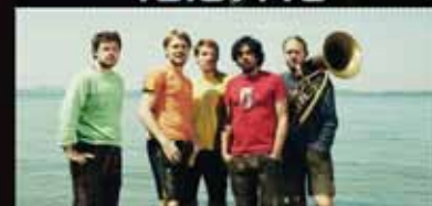
LA BRASS BANDA