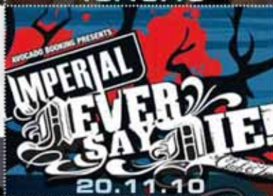
IMPERIAL NEVER SAY DIE!